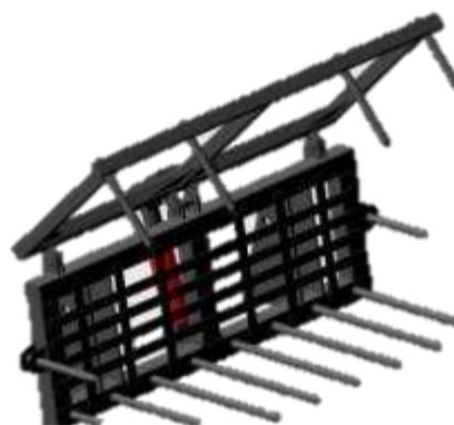
Вилы для сенажа