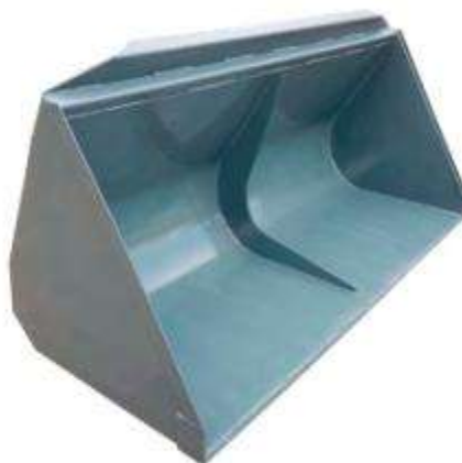
Ковш 0.8 толщина метала 4 мм