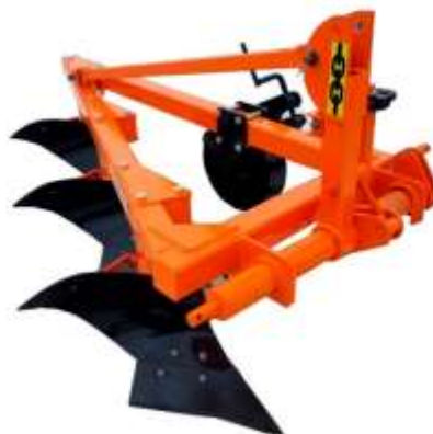
Плуг на МТЗ НПЛ 3 * 35см