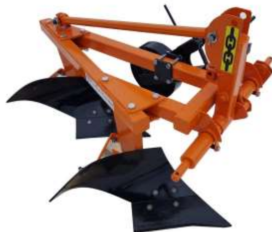
Плуг на Т-25 на минитрактор (2 х 25)