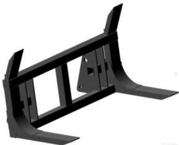
Вилы для леса