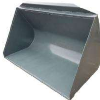
Ковш 0.6 толщина метала