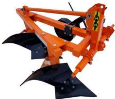
Плуг на Т40 НПЛ 2* 35 см