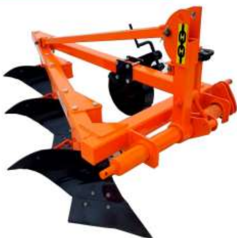
Плуг 3х корпусный 3*25 (Т40)